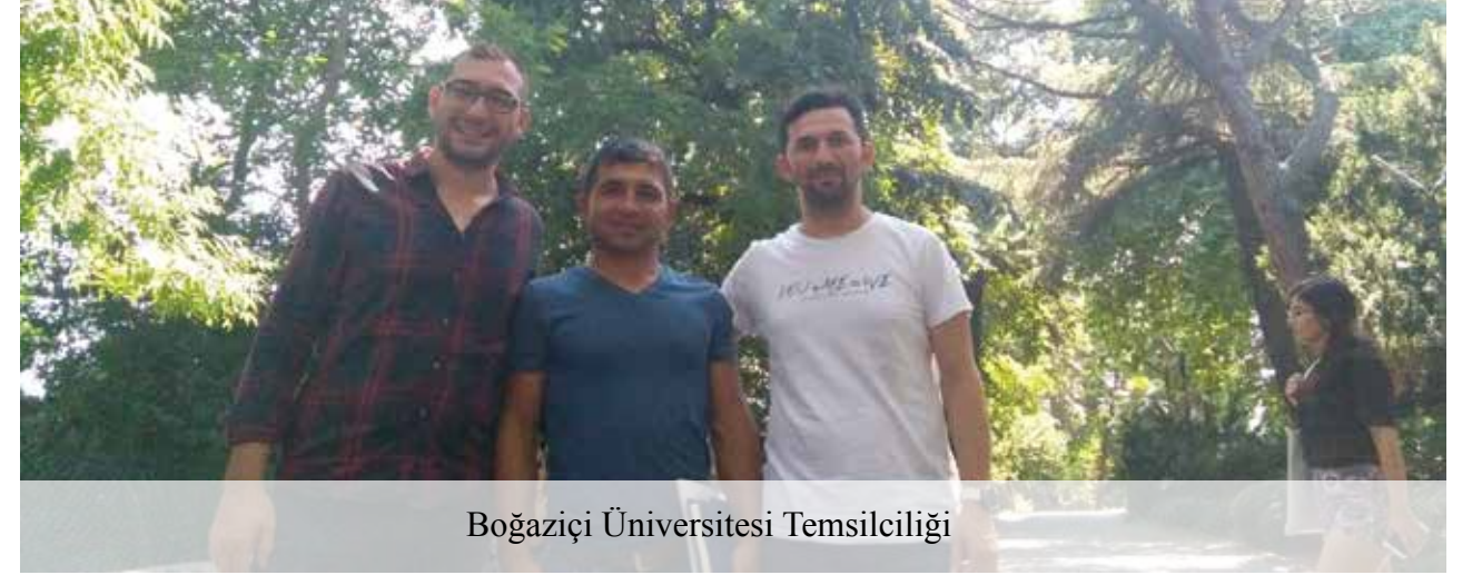
Boğaziçi Üniversitesi Temsilciliği