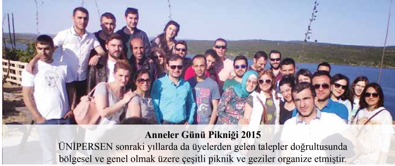
Anneler Günü Pikniği 2015

ÜNİPERSEN kurucu üyeleri kuruluş temellerini atarken ilk olarak Anneler Günü Pikniği organize ederek sendikanın temellerini atmıştır.