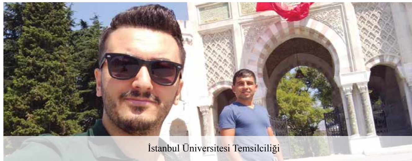
İstanbul Üniversitesi Temsilciliği

Temsilcilik ziyaretleri 2020 yılında pandemi nedeniyle sekteye uğrasa da pandeminin etkilerinin azalmasıyla birlikte kaldığımız yerden temsilcilik ziyaretlerine devam edilecektir.