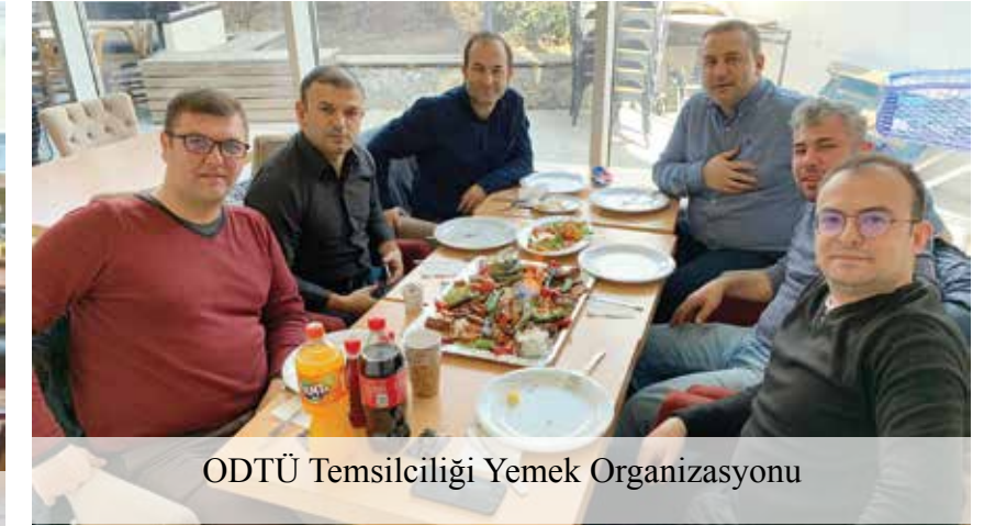
ODTÜ Temsilciliği Yemek Organizasyonu