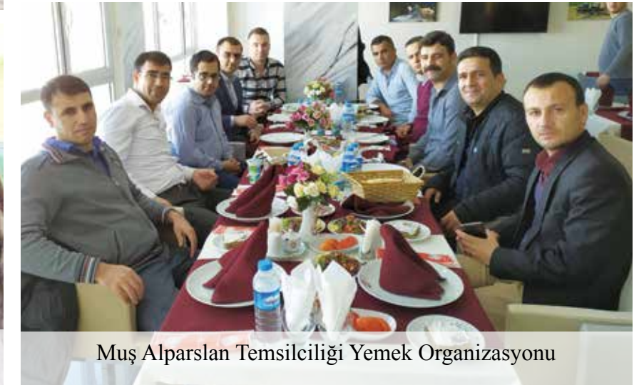
Muş Alparslan Temsilciliği Yemek Organizasyonu