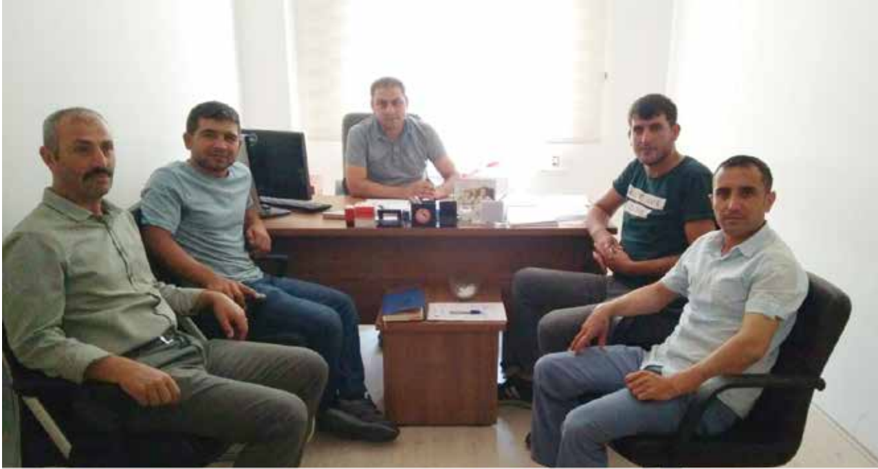
Erzurum Teknik Üniversitesi