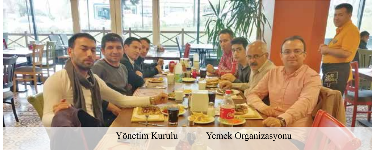
Yönetim Kurulu Yemek Organizasyonu