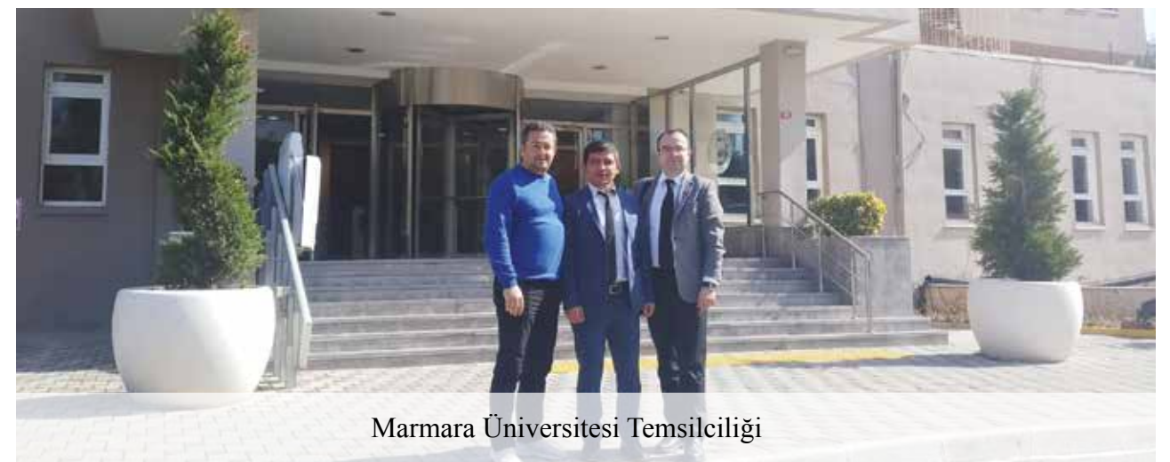
Marmara Üniversitesi Temsilciliği