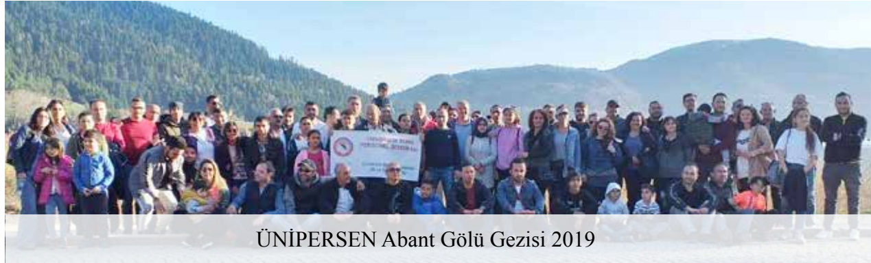
ÜNİPERSEN Abant Gölü Gezisi 2019

ÜNİPERSEN sonraki yıllarda da üyelerden gelen talepler doğrultusunda bölgesel ve genel olmak üzere çeşitli piknik ve geziler organize etmiştir.