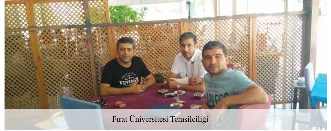
Fırat Üniversitesi Temsilciliği