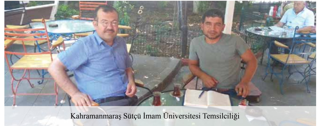
Kahramanmaraş Sütçü İmam Üniversitesi Temsilciliği