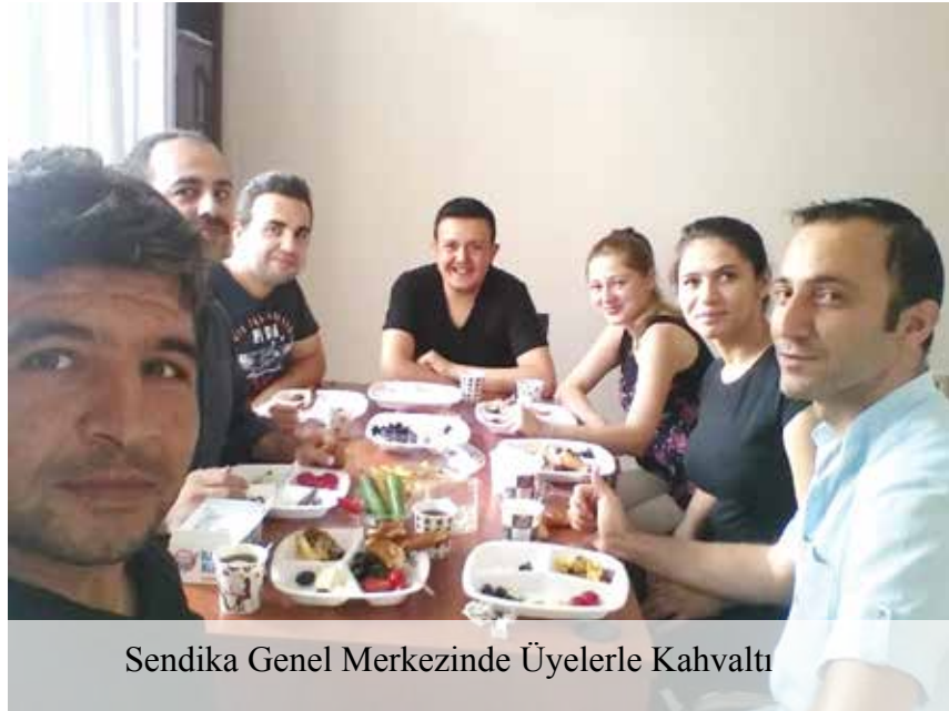
Sendika Genel Merkezinde Üyelerle Kahvaltı