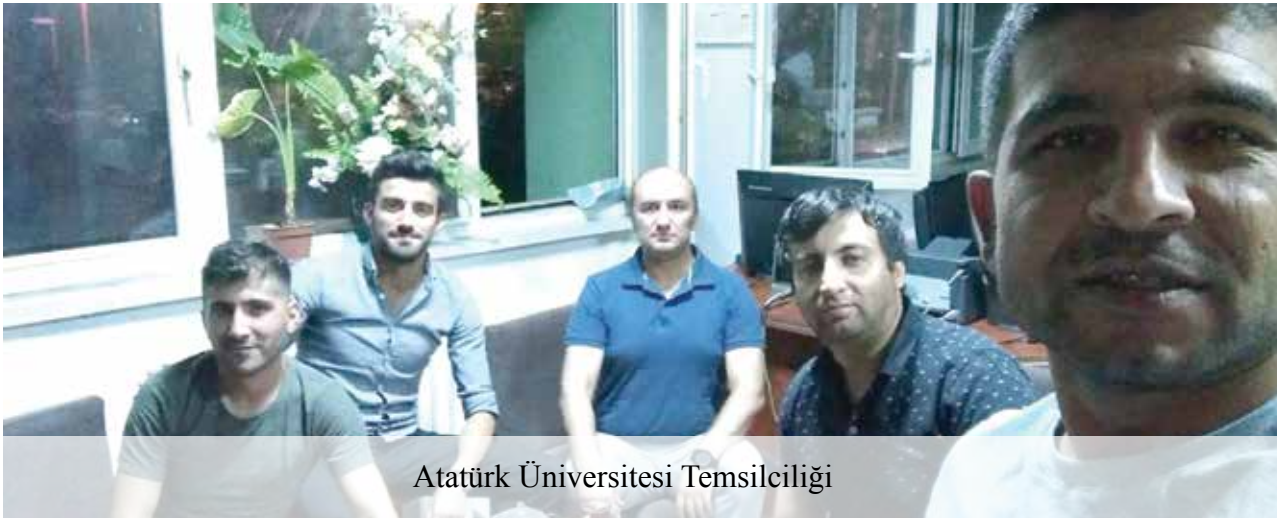
Atatürk Üniversitesi Temsilciliği