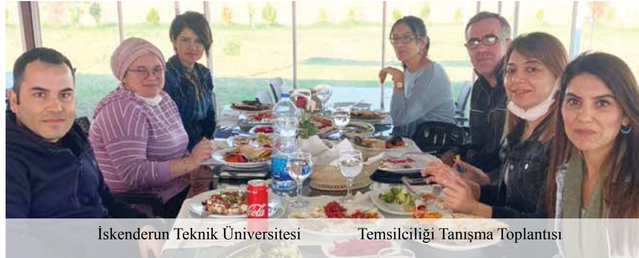
İskenderun Teknik Üniversitesi Temsilciliği Tanışma Toplantısı