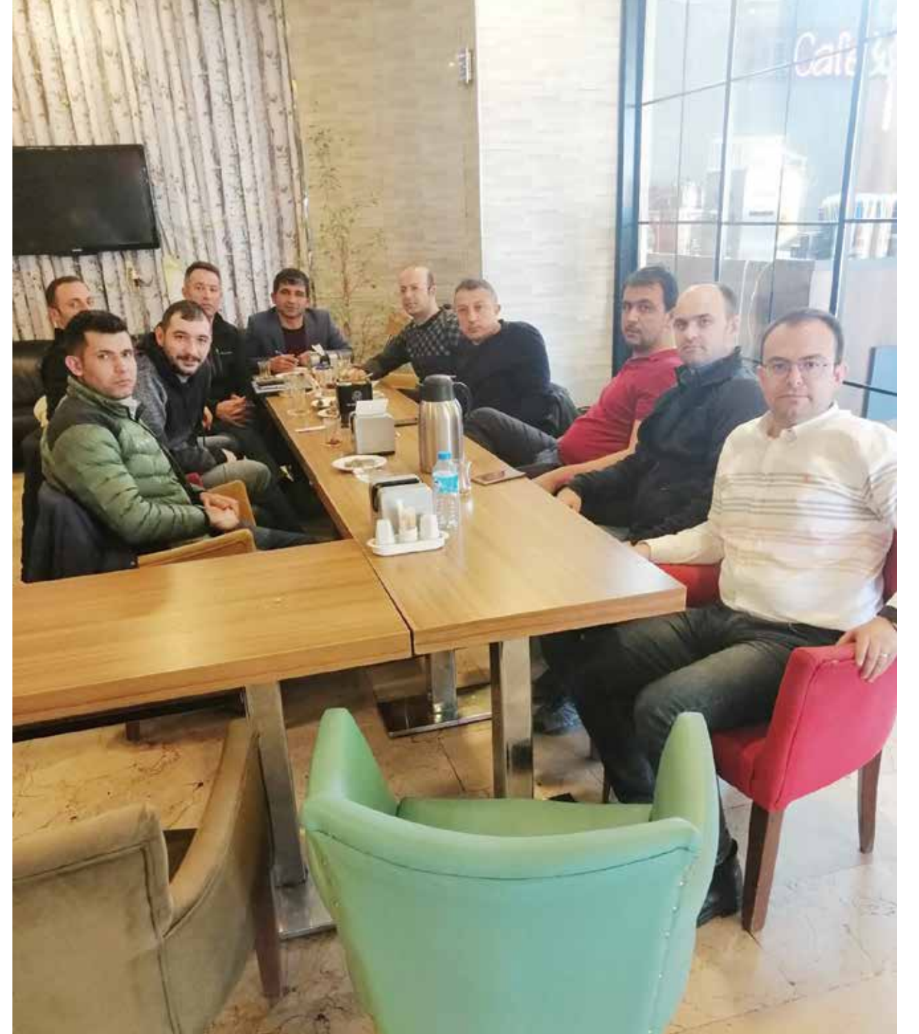
Temsilciler Toplantısı Ankara