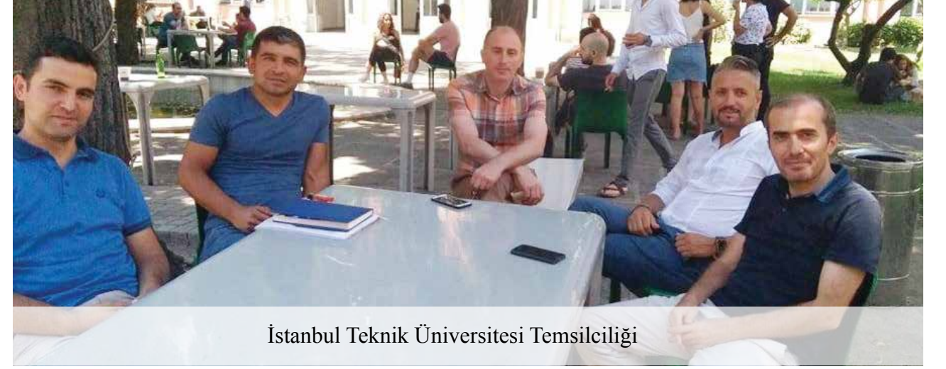
İstanbul Teknik Üniversitesi Temsilciliği