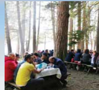
Gezi / Piknik