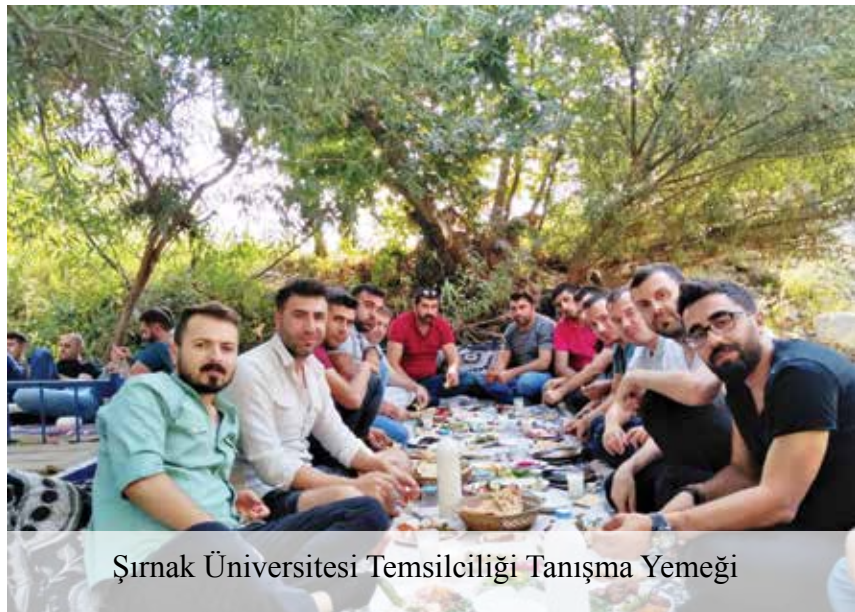
Şırnak Üniversitesi Temsilciliği Tanışma Yemeği