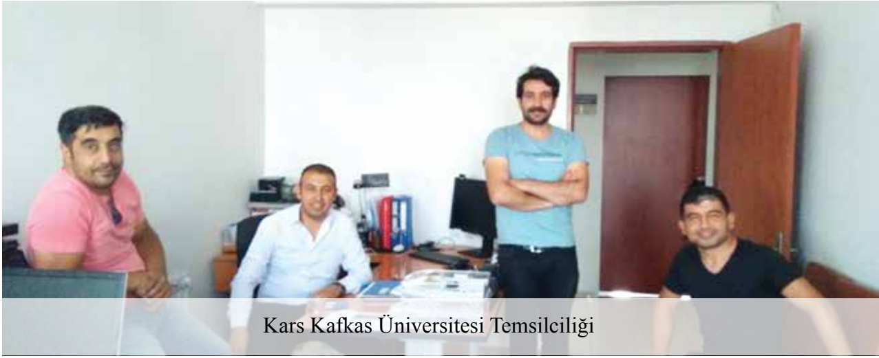
Kars Kafkas Üniversitesi Temsilciliği