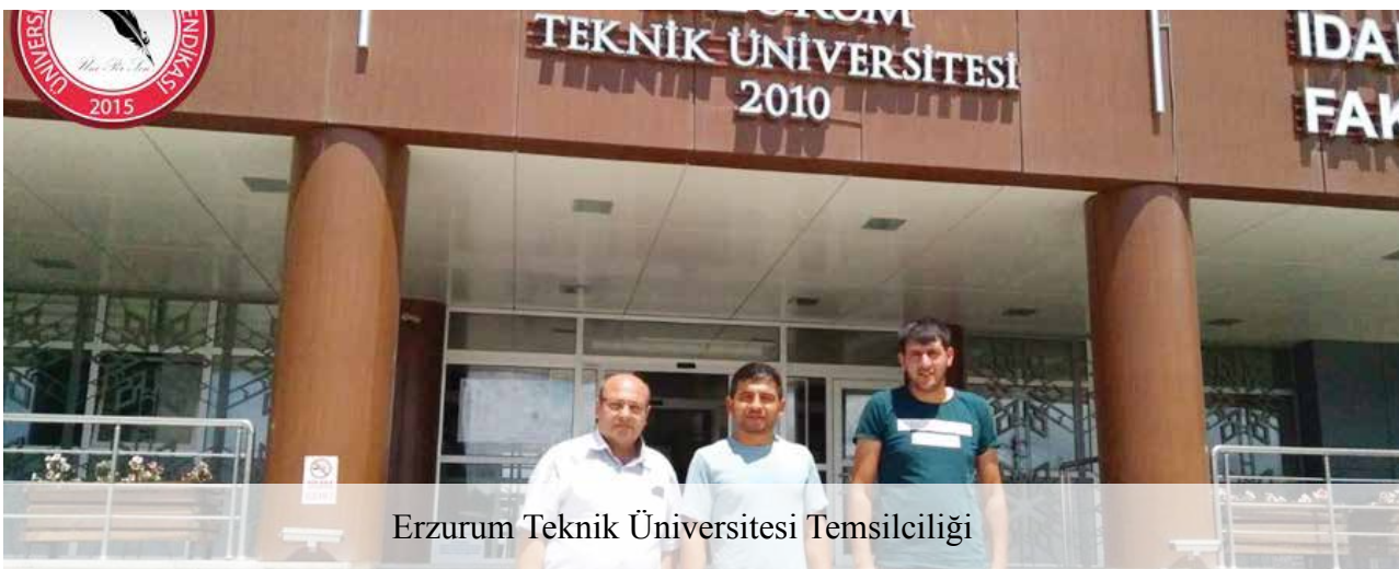
Erzurum Teknik Üniversitesi Temsilciliği