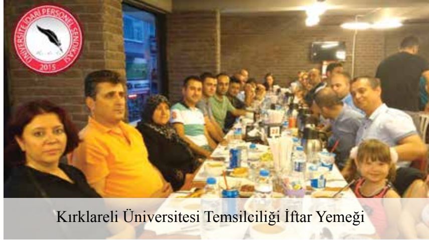
Kırklareli Üniversitesi Temsilciliği İftar Yemeği