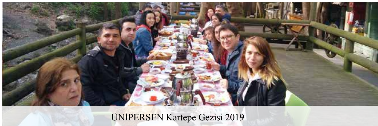
ÜNİPERSEN Kartepe Gezisi 2019