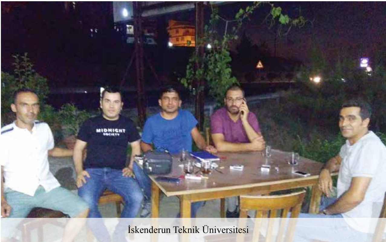
İskenderun Teknik Üniversitesi