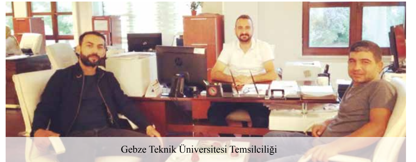
Gebze Teknik Üniversitesi Temsilciliği